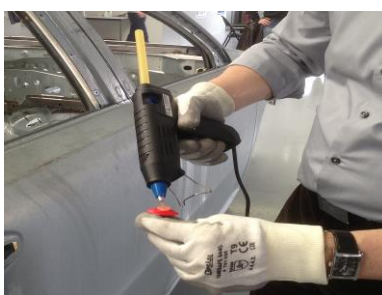
❷ Aplicar la cola